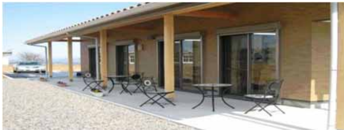
< サロンきずな >

「サロンきずな」は、こうしたボランティア組織の活動拠点という位置づけとともに、地域の幅広い年代の人たちが気軽に立ち寄り交流を深める場として活用されています。「サロンきずな」では、普段は、隣接する小学校からの帰りに子どもたちが立ち寄り、カルピスを飲みながら宿題をしたり、「きずな」に居るおじさんやおばさんと話をしたりしています。また、子ども関連の催しとしてリコーダーなどの音楽発表会、伝承行事として「どんど」を行ったりしています。地域内での世代間交流が日常的に行われている拠点となっています。「サロンきずな」は、地域発信で立ち上がった取組みです。「夢づくり広場」や「まちの保健室」など行政計画に位置づけて取り組んできた地域資源と連携しながら、地域の人々が地域の力で子どもたちを地域で育てるための拠点として、発展途上の場となっています。なお、近隣地域で栽培される農作物を販売するなどし、これらの売り上げを「サロンきずな」の管理運営にかかる費用に充てて、施設の自主運営を行っていただいています。