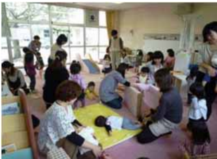
< マイ保育ステーションでの活動の様子 >