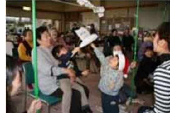
高齢者と児童の交流の様子