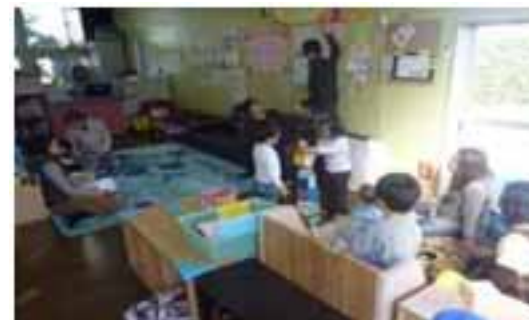
地域子育て支援拠点施設「あいあい」 における活動の様子